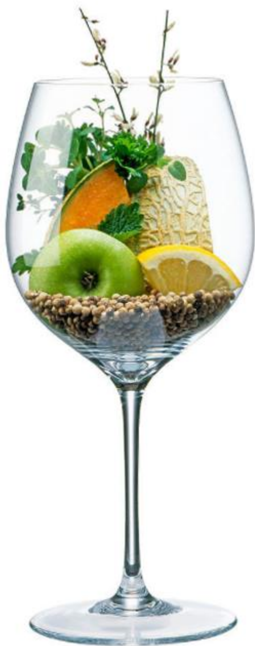
Abb. 2: Aromen des Grünen Veltliners // Aromas of the Grüner Veltliner .

Gehalt von rund 500 ng/L (0,0005 mg/L) im Wein enthalten und hat eine sehr niedrige Wahrnehmungsschwelle (16 ng/L).